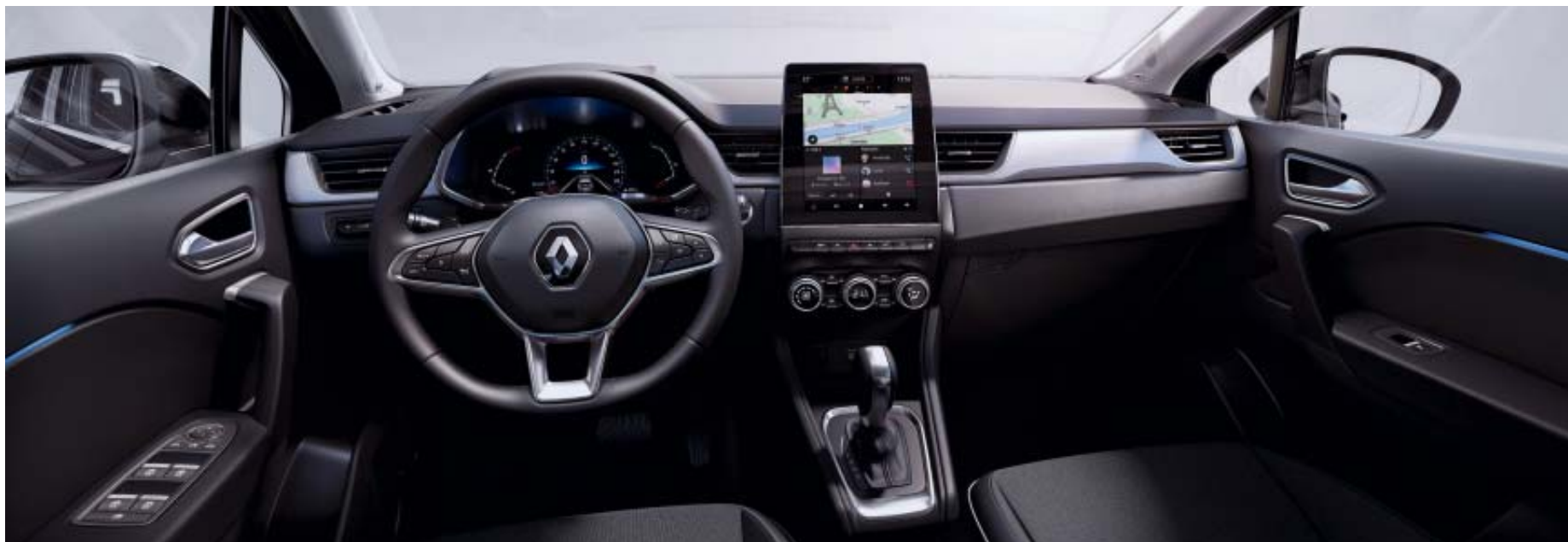
EASY LINK 9,3" disponível em opção