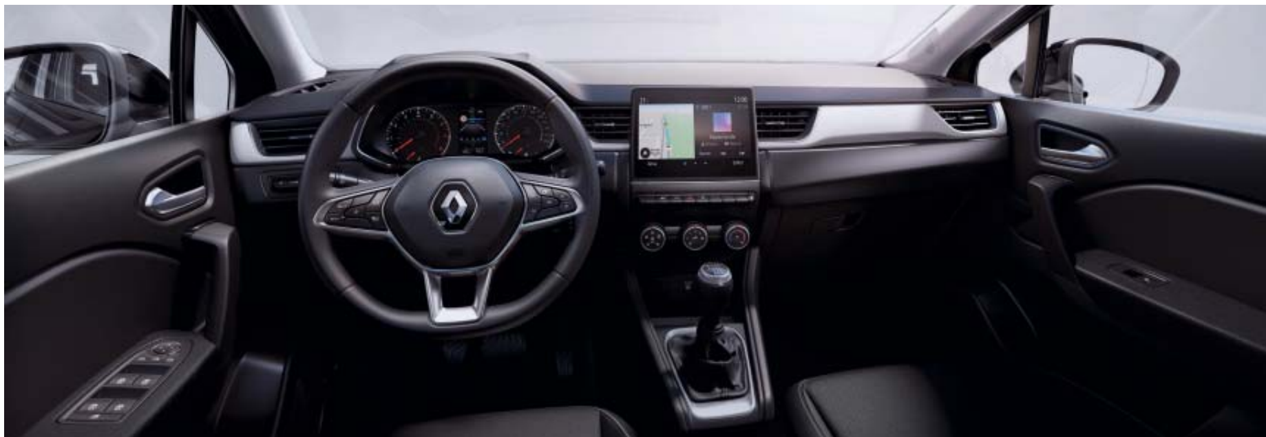
EASY LINK 7" com navegação disponível em opção